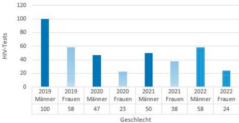
Abbildung 2: Anzahl der in den Beratungsstellen des Gesundheitsamts Ostalbkreis durchgeführten HIV-Tests in den Jahren 2019-2022.

Es wurden in diesem Zeitraum keine positiven Befunde festgestellt. Das Ergebnis kam nach Absprache bis auf Weiteres auch telefonisch abgefragt werden. Zusätzlich zu den Tests werden von den Ärzten in den anonymen Sprechstunden zum Thema HIV/Aids jährlich rund 60-220 Minuten telefonische Beratungsgespräche ohne Testung geführt.